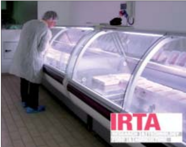
Figura 1. Vitrina refrigerada EURO LX 334 en la que se conservaron las bandejas de carne envasada en MAP.

comercial del producto envasado. Por ello, es necesario precisar las condiciones que permitan lograr al mismo tiempo una buena terneza de la carne y una adecuada estabilidad del color.